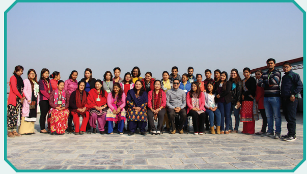
एटविन सदस्य संस्थाहरूलाई मानव बेचबिखन विरुद्धको प्रशिक्षक प्रशिक्षण (TOT)