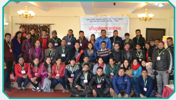
विभिन्न जिल्लाका संचारकर्मीहरूसँग मानव बेचबिखन विरुद्ध अभिमुखिकरण कार्यक्रम