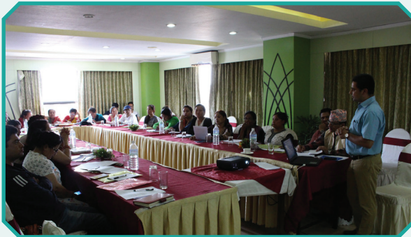
“मानव बेचबिखन तथा CSEC न्यूनीकरणका लागि स्थानीय तहको भुमिका” विषयक परामर्श कार्यक्रम