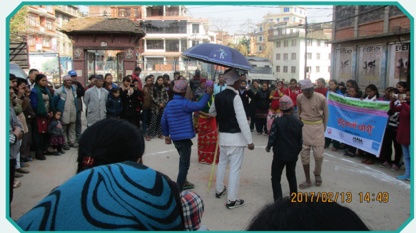
मानव बेचबिखन तथा सुरक्षित स्थानागमन विषयक चेतनामूलक कचहरी नाटक, काभ्रे