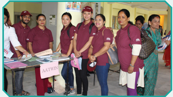
मानव बेचबिखन विरुद्धको एघारौँ राष्ट्रिय दिवसमा IEC सामग्रीको स्टल, २०७४