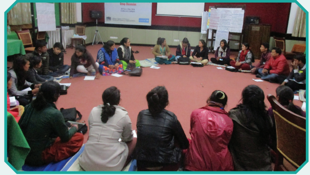
५ वटा जिल्लाका “सामुदायिक कार्यकर्ताहरूका लागि बैठक सञ्चालन निर्देशिका” विषयक तालिम