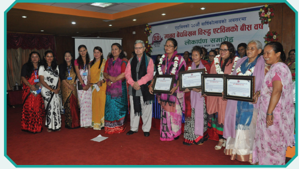
पुस्तक लोकार्पण समारोहमा मानव बेचबिखन विरुद्धको अभियानमा योगदान गरेका सम्मानित व्यक्तित्वहरु