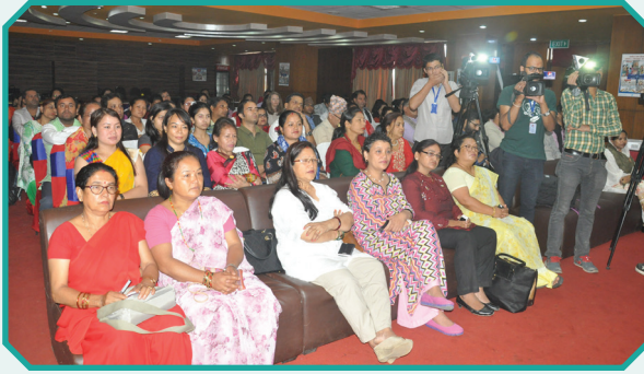
“मानव बेचबिखन विरुद्ध एटविनको २० वर्ष” लोकार्पण समारोह