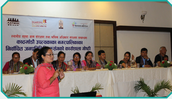
स्थानीय तहका प्रतिनिधिहरूसँग “बाल संरक्षण तथा श्रमिक अधिकार संरक्षण” सम्बन्धि कार्यक्रम