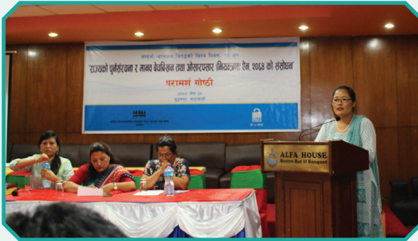
“राज्यको पुनर्संरचना र मानव बेचबिखन तथा ओसारपसार (नियन्त्रण) ऐन संसोधन” विषयक परामर्श गोष्ठी