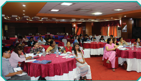
मनोरञ्जन क्षेत्रमा कार्यरत संस्थाहरूका लागि कार्यसम्पादन मार्गनिर्देशिका विषयक अभिमुखीकरण