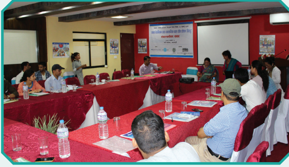
मानव बेचबिखन तथा बालबालिकाको व्यवसायिक यौन शोषण विरुद्ध संचारकर्मीसँग अन्तर्क्रिया