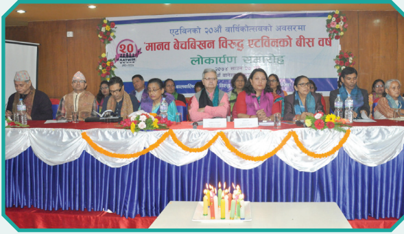
“मानव बेचबिखन विरुद्ध एटविनको २० वर्ष” लोकार्पण समारोह