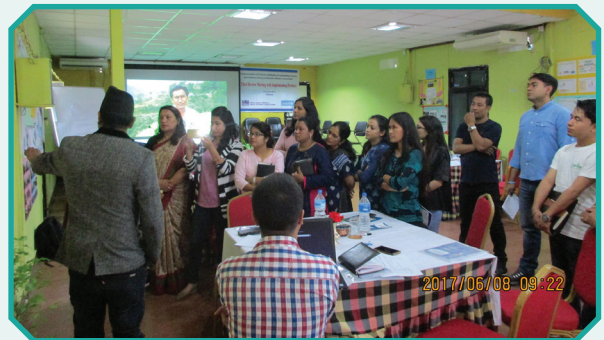
मानव बेचबिखन तथा सुरक्षित स्थानागमन परियोजनाका कार्यान्वयन संस्थाहरूसँग समिक्षा बैठक