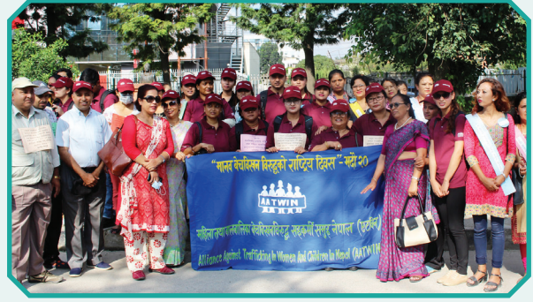
मानव बेचबिखन विरुद्धको एघारौं राष्ट्रिय दिवस, २०७४